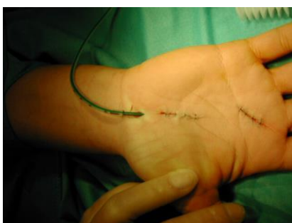
Operation bei KTS und gleichzeitige OP einer Sehnenscheidenenge am 3. Finger

Wir empfehlen außerdem nach der Operation selbständige Bewegungsübungen und Narbenmassagen.