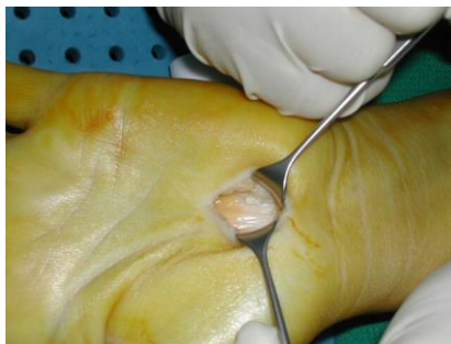
Op bei Karpaltunnelsyndrom

Wir behandeln das gesicherte Karpaltunnelsyndrom in den meisten Fällen mit einer Operation. Der Eingriff wird ambulant durchgeführt, das heißt, unsere Patienten können nach einer Überwachungszeit noch am OP-Tag in die Häuslichkeit zurückkehren. Diese ambulante Operation ist in einer lokalen Betäubung des Unterarmes ( Venenanästhesie nach Bier ) möglich.